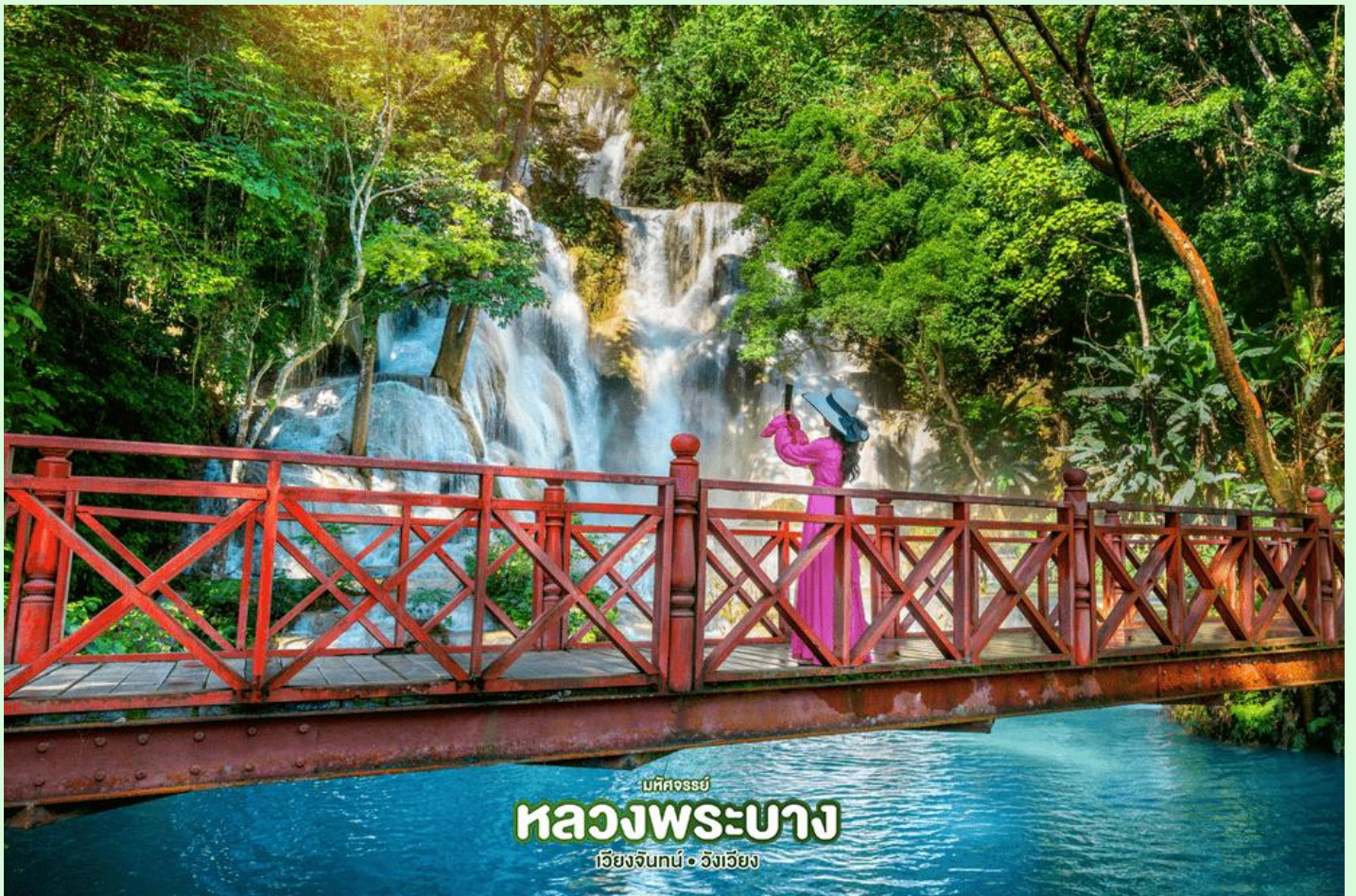
มหัสจรรย์ หลวงพระบาง เวียงจันทน์ • อังเวียง

จากนั้น นำเดินทางผ่านหมู่บ้านชนบทชมวิถีชีวิตของชาวบ้านสู่ น้ำตกตาดวางสี (Kuang Xi Waterfall) โดยผ่านหมู่บ้านชนบทริมถนน 2 ข้างทาง เป็นหนึ่งในน้ำตกที่สวยงามที่สุดในเขตหลวงพระบาง มีแม่น้ำใสสีมรกตตลอดปี ชมความงามของน้ำตกที่ตกลงหล่นเป็นชั้นๆ อย่างสวยงาม มีสะพานและเส้นทางเดินชมรอบๆ น้ำตก ให้เวลาอิสระดื่มด่ำกับธรรมชาติ และ อิสระกับการเล่นน้ำ