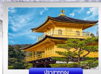
ปราสาททอง