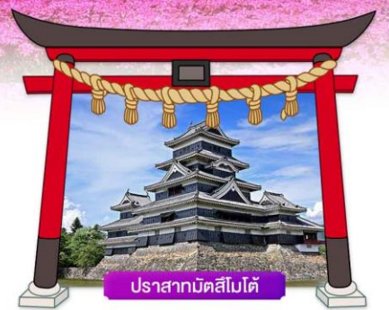
ปราสาทมัตสึโมโด้