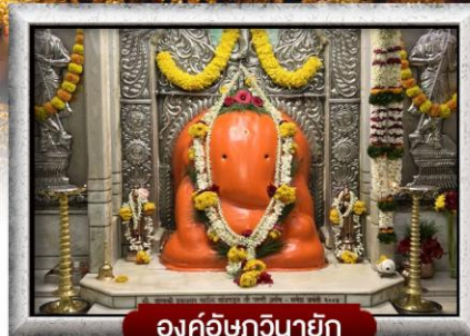
องค์อักษวินายก