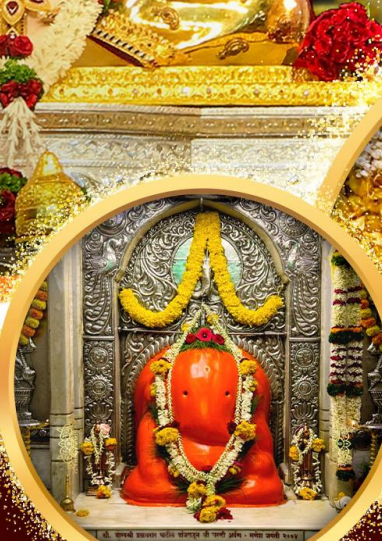
องค์อักษฏินายก

พิเศษ! ร่วมพิธี Abhishekam ที่ Dagdusheth Temple