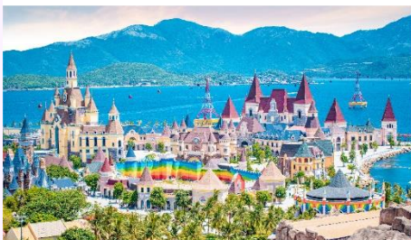
VinWonders NHA TRANG