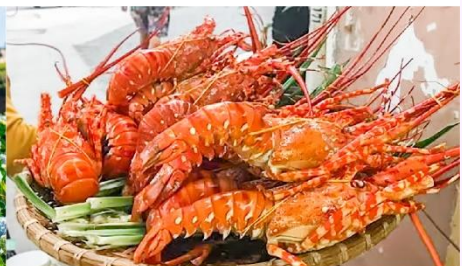
Nha Trang Night Market

*ทางบริษัทฯ ขอสงวนสิทธิ์ในการสลับโปรแกรมทัวร์ตามความเหมาะสมขึ้นอยู่กับสถานการณ์หน้างาน โดยคำนึงถึงผลประโยชน์ของลูกค้าเป็นสำคัญ