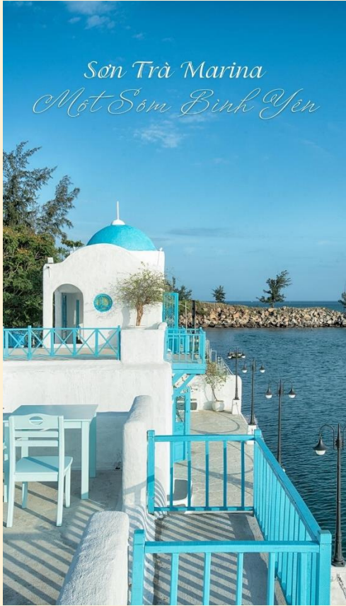
Sơn Trà Marina Một Sầm Bỉnh Yên