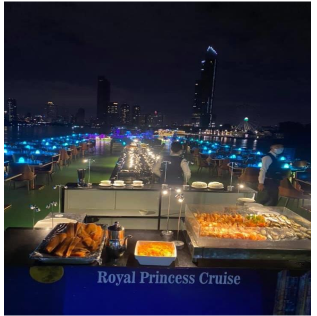
Royal Princess Cruise